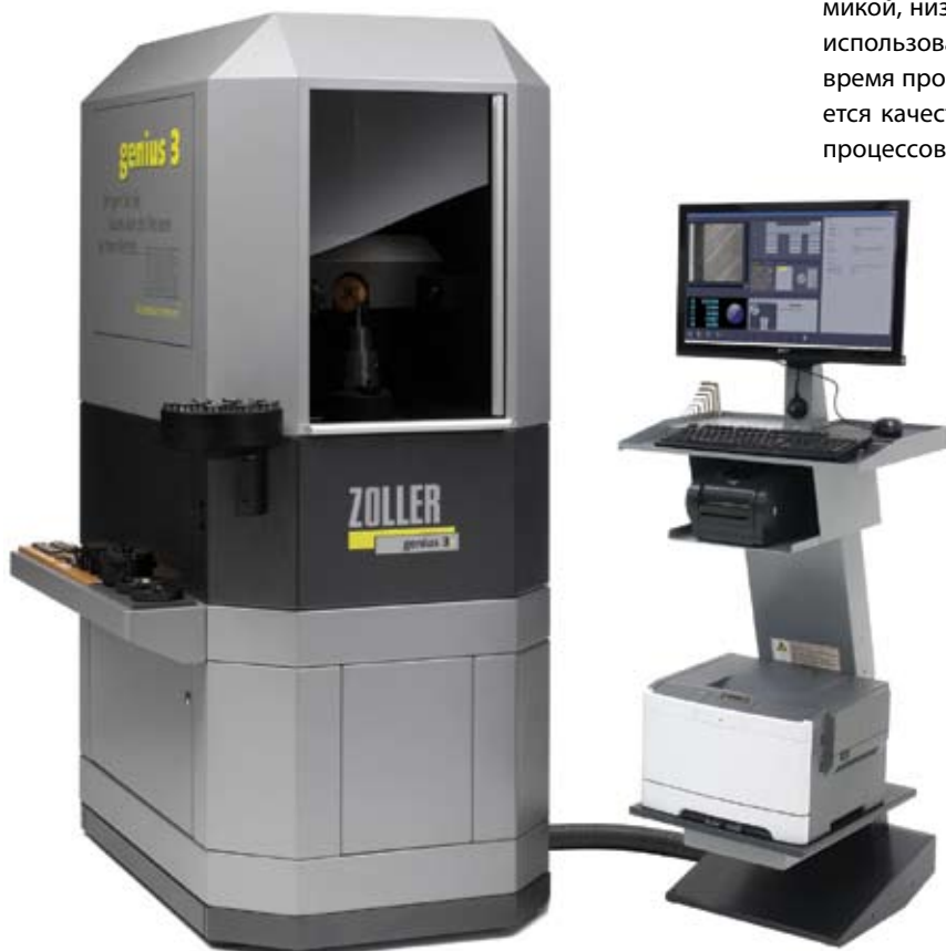
Инновационная технология и эргономика работы, поворотная 3D ПЗС-камера, управляемая ЧПУ, и светодиодная подсветка

В настоящее время было продано уже более 30 000 устройств предварительной настройки и измерения с программным обеспечением, не имеющим равных себе в мире. Это наглядно иллюстрирует превращение генератора идей в основного игрока на рынке, который все больше уходит от просто производителя устройств предварительной настройки и измерения и становится глобальным поставщиком технологий и системных решений.