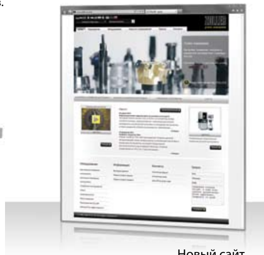
Новый сайт на русском языке: www.zoller-ru.com

Устройства предварительной настройки, измерения и проверки отличаются высочайшим уровнем точности, эргономикой, низкими требованиями к обслуживанию и удобной в использовании технологией. Благодаря этому сокращается время простоя станка, уменьшается процент брака, повышается качество продукции и эффективность технологических процессов.